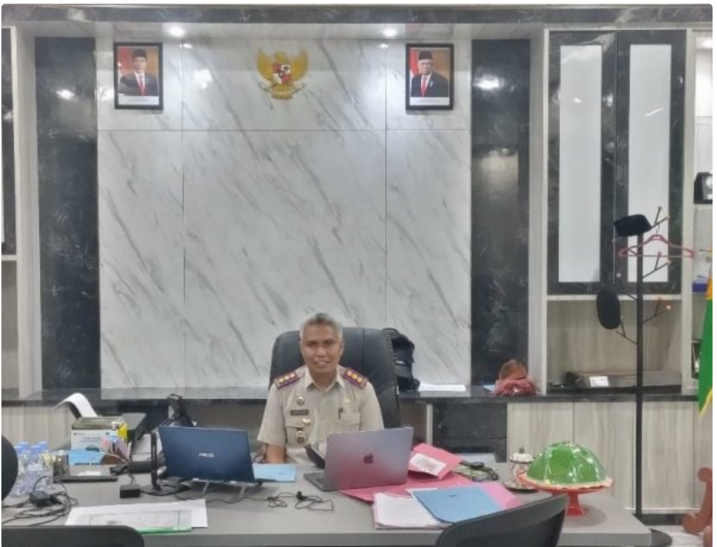
Terlihat Elegan, Ruang kerja Kepala ATR/BPN Morowali