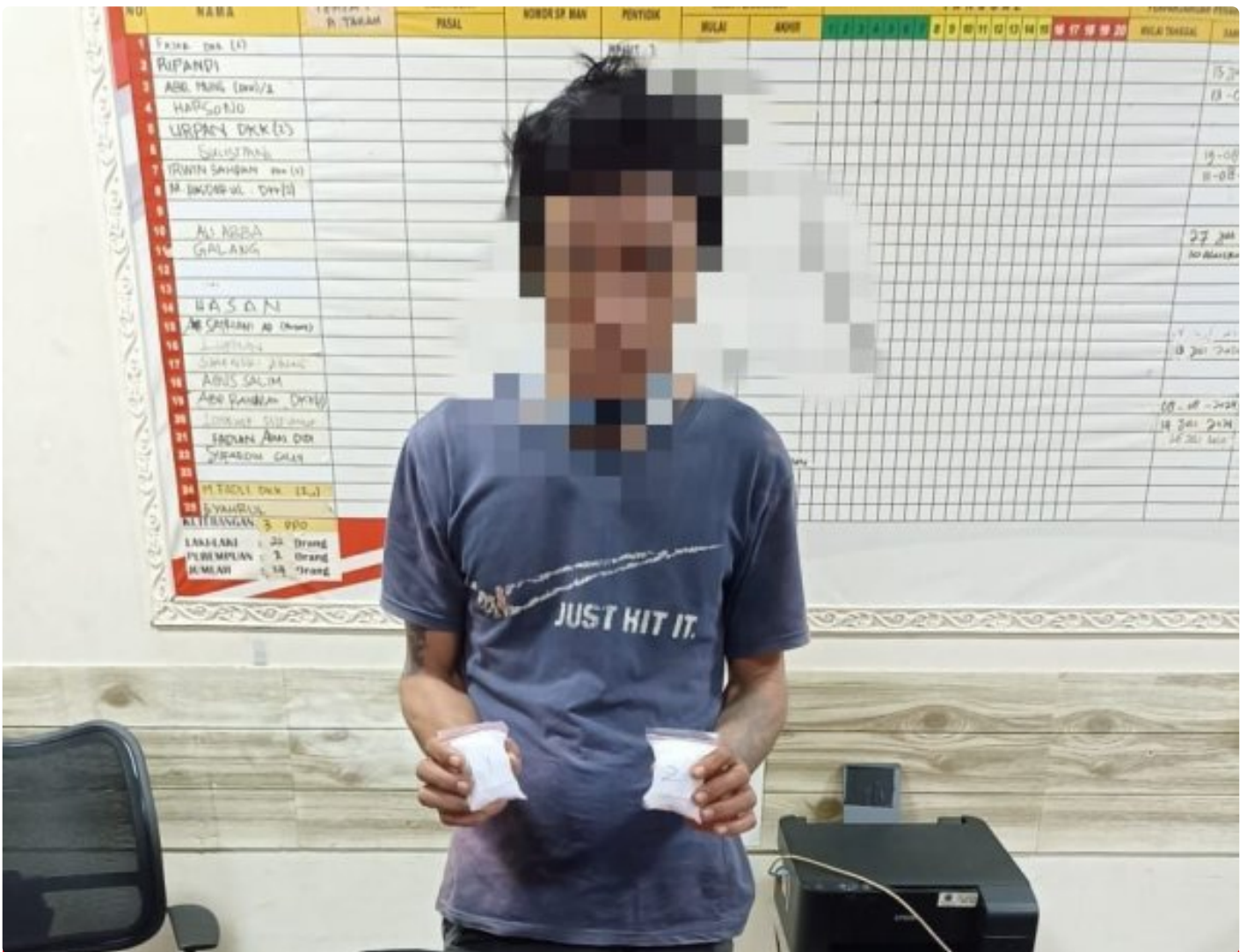
Polres Morowali amankan Pelaku Narkotika dari Bahodopi

MOROWALI, Sulawesi Tengah- Kepolisian Resort (Polres) Morowali berhasil mengungkap kasus Tindak Pidana (TP) Narkotika Golongan I jenis shabu pada Rabu malam (10/07/2024), di Desa Bahomakmur, Kecamatan Bahodopi,